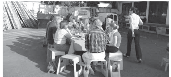
Kommunikationstreffen am „Eckigen Tisch“

Jede Einrichtung erstellt ein individuelles Konzept, entsprechend ihren spezifischen Besonderheiten zu Lage, Struktur und Inhalten. Es ist darzustellen, wodurch gemeinwesenorientierte Altenarbeit am konkreten Standort der Einrichtung lebt.